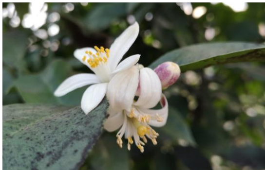
Fleur d'oranger