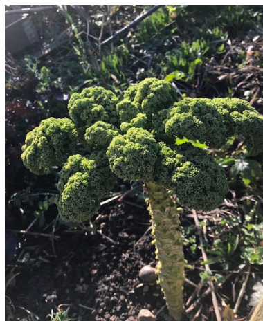
Chou Kale