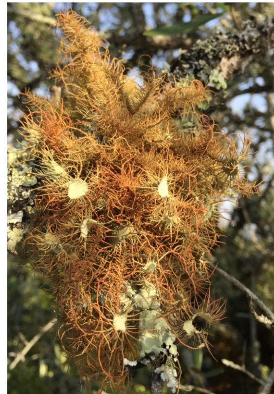
Usnea rubicunda

PROGRAMME D'ACTIVITÉS MARS À SEPTEMBRE 2020