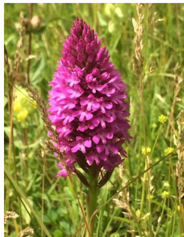
Anacamptis pyramidalis